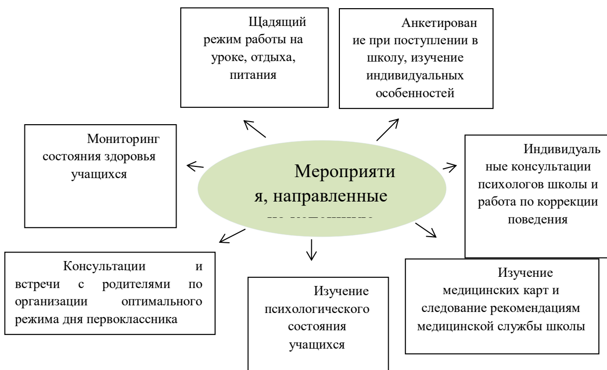
Рис. Мероприятия, направленные на успешную адаптацию первоклассников к школе

Врачом, психологом и педагогами проводится работа по изучению адаптации к школе первоклассников и адаптации к среднему звену учащихся 5х классов.