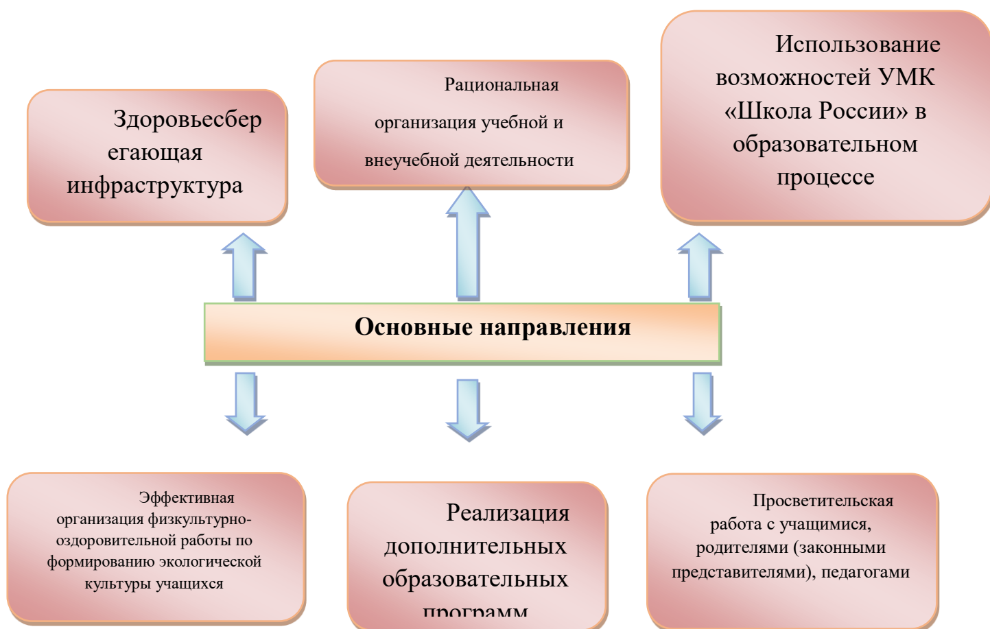
Рис. Основные направления деятельности в рамках ЗОЖ

Работа по формированию экологической культуры, здорового и безопасного образа жизни на уровне начального общего образования ведется по направлениям: