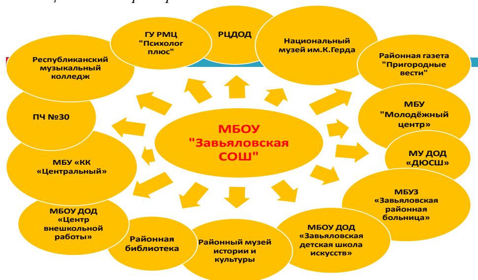
Рис. Социальные партнёры МБОУ «Завьяловская СОШ с УИОП»

В формировании такого уклада свои традиционные позиции сохраняют учреждения дополнительного образования, культуры и спорта. Таким образом, важным условием эффективной реализации задач духовно-нравственного развития и воспитания учащихся является эффективность педагогического взаимодействия различных социальных субъектов при ведущей роли педагогического коллектива школы.