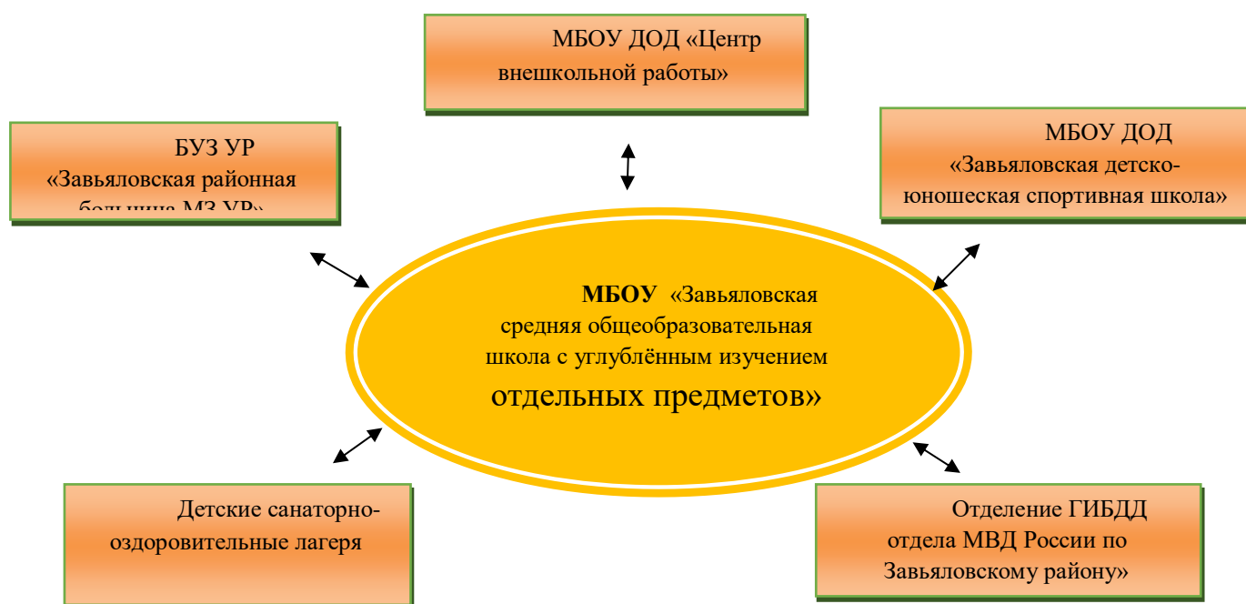
Рис. 3 Сотрудничество школы с другими учреждениями