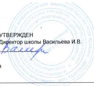
График проведения оценочных процедур в 5-9 классах МБОУ "Завьяловская СОШ с УИОП" на 2024-2025 учебного года