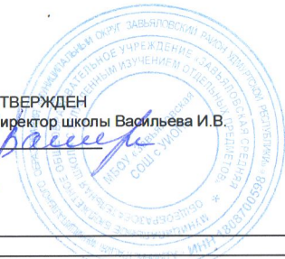
График проведения оценочных процедур в 5-9 классах МБОУ "Завьяловская СОШ с УИОП" на 2024-2025 учебного года